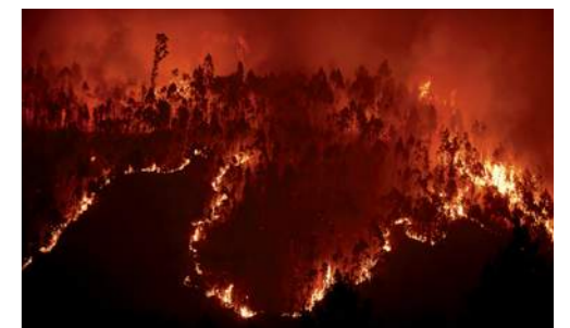
INFERNO NELLA FORESTA. Il rogo dei boschi di Pedrógão Grande (Portogallo): innescato da un fulmine.

(1942-1977) è stato colpito da 7 fulmini. È finito nel Guinness dei primati. 1994, Dronka, Egitto: un fulmine colpisce tre serbatoi da 5mila tonnellate di carburante. I contenitori collasano sulla ferrovia, e l'alluvione trasporta il materiale in fiamme al villaggio di Dronka: 469 morti. 2016, Norvegia: un fulmine uccide una mandria di 323 renne selvatiche.